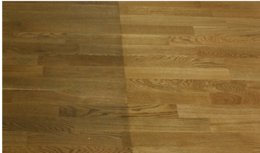
Durch fachgerechte Reinigung und Nachbehandlung können geölte Böden sehr gut instandgehalten werden.

paraturen) sind auch bei nicht filmbildenden Beschichtungen schwierig, insbesondere hinsichtlich des Farbgleiches an die umgebende Fläche. Großflächige Reinigungsarbeiten oder die Reinigung gesamter Dielen sind zu bevorzugen.